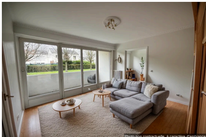
Photo non contractuelle, à caractère d'ambiance