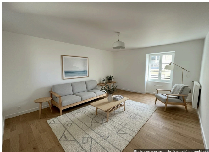
Photo non contractuelle, à caractère d'ambiance